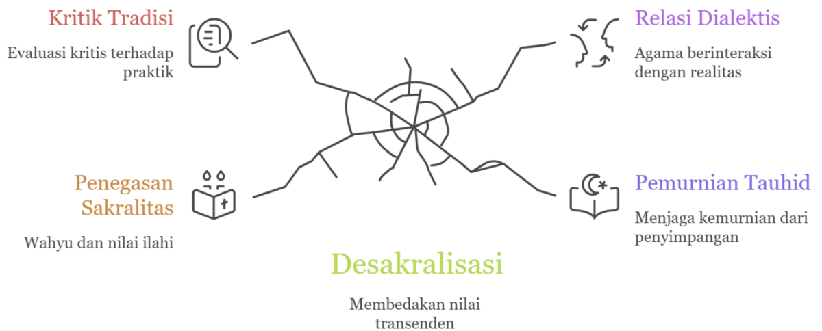
Gambar 1. Desakralisasi dalam Pemikiran Nurcholish Madjid