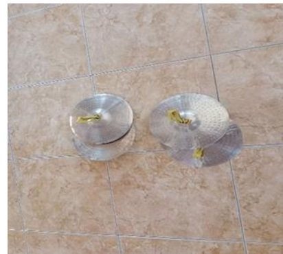
Gambar Alat Musik Simbal