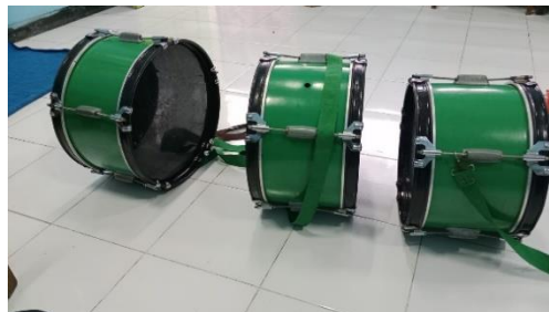
Gambar Alat Musik Bass Drum