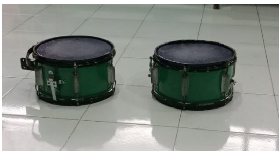
Gambar Alat Musik Snare Drum Drum

Metode drill menjadi bagian penting dalam kegiatan seni musik drum karena keterampilan bermain alat musik tidak dapat dikuasai hanya melalui teori, tetapi membutuhkan latihan yang konsisten. Berdasarkan hasil observasi, anak yang rutin mengikuti latihan menunjukkan peningkatan kemampuan dalam mengingat pola lagu dan ketukan. Anak juga terlihat lebih percaya diri ketika memainkan alat musik dibandingkan pada awal latihan. (Redjasaputra, t.t.)